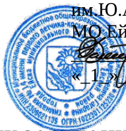
ГРАФИК ЗАСЕДАНИЙ ШТАБА ВОСПИТАТЕЛЬНОЙ РАБОТЫ МБОУ ГИМНАЗИЯ № 14 ИМ. Ю.А.ГАГАРИНА ГОРОДА ЕЙСКА НА 2016-2017 УЧ.ГОД